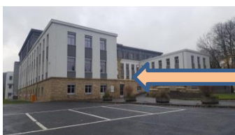
hlavní vchod vstupní hala

PÁ není úřední den ( možnost pouze podání žádosti na informacích od 8.00 do 11.00 h )