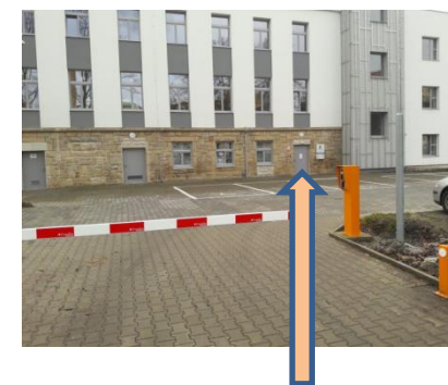
boční bezbariérový vchod zprava budovy