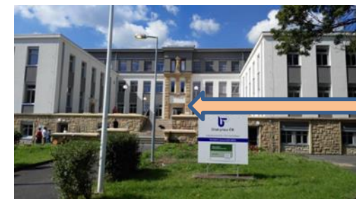
Hlavním vchodem, ve vstupní hale se dáte vlevo

PÁ není úřední den ( možnost pouze podání žádosti na informacích od 8.00 do 11.00 h )