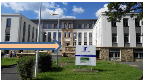
Hlavním vchodem, ve vstupní hale se dáte vpravo

Objednání možné přes email pracovníka, naleznete na http://portal.mpsv.cz/web/upcr-ulk/kop/decin/orgstr